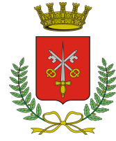
COMUNE DI MORBEGNO