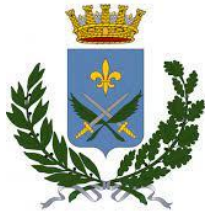
COMUNE DI SONDRIO