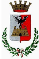
COMUNE DI TIRANO