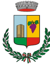
COMUNE DI POGGIRIDENTI